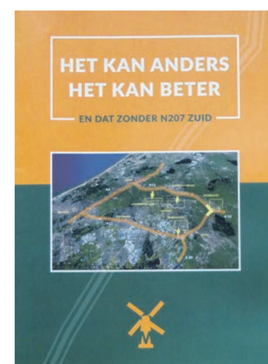
Het onderzoek in opdracht van Het Molenberaad